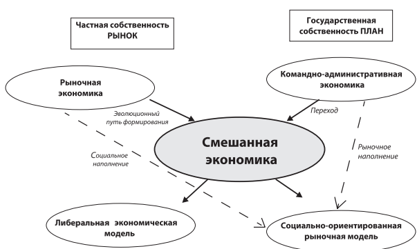
Рис. 1. Взаимосвязи между типами экономических систем и либеральной и социально-ориентированной рыночной моделями