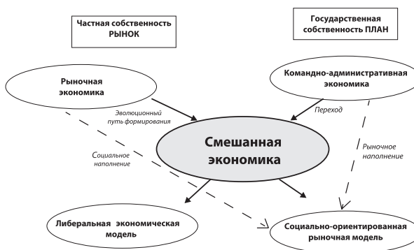
Рис. 1. Взаимосвязи между типами экономических систем и либеральной и социально-ориентированной рыночной моделями